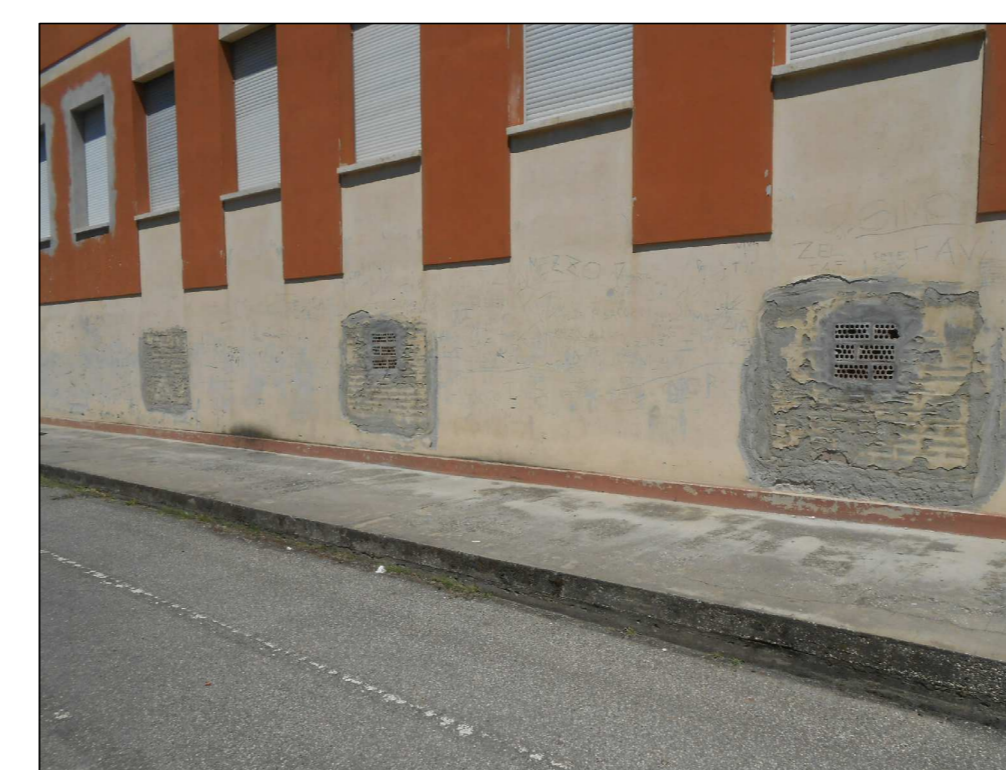
PART. GRIGLIATO ZINCATO A LAMELLE ORIZZONTALI

RIPRISTINARE N°6+6 APERTURE TAMPONATE PER VENTILAZIONE ALI SEMINTERRATO DA TAMPONARE SUCCESSIVAMENTE CON GRIGLIATI ZINCATI A LAMELLE ORIZZONTALI DIM. 1,00x1,30 m (disegno semplice a scelta della Direzione Lavori - vedi esempio sotto)